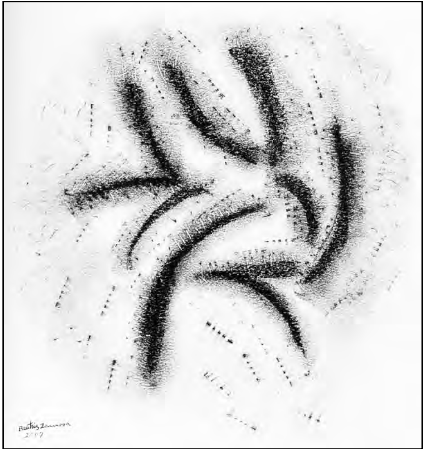
El agua purifica la turbulencia de mi cerebro y me pacifica, 2007.

Integrando a su enfoque los elementos aportados por todas estas vertientes, Mandel postula que el secreto de las ondas está en la evolución de la tasa de ganancia de largo plazo, porque estima que el epicentro del sistema capitalista está en el proceso de valorización. Presenta datos del comportamiento de la tasa de interés en períodos prolongados cómo índices representativos de la tasa de beneficio, distinguiendo el carácter de esta última variable en el corto y en el largo plazo. Mientras que en el primer caso, la tasa de beneficio oscila con el movimiento valorizante y desvalorizante que genera la propia dinámica de la acumulación, en el segundo caso el comportamiento de la tasa de ganancia está decisivamente influenciado por grandes acontecimientos político-sociales, que imprimen un signo positivo o negativo al “clima general” de los negocios y la inversión.